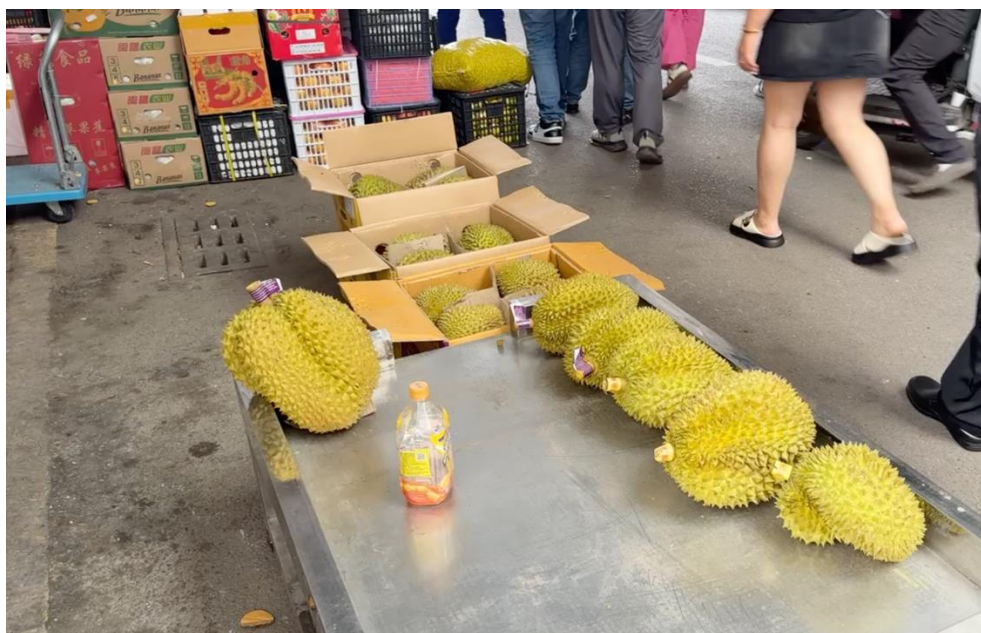
ภาพที่ 4 การคัดแยกคุณภาพสินค้าที่มีการนำเข้ามาจากต่างประเทศ

อีกด้านหนึ่งของการศึกษาดูงานครั้งนี้ ยังได้เปิดเผยถึงวิธีการจัดการกับสินค้าที่ไม่ได้มาตรฐานหรือที่เรียกกันว่าสินค้าเกรดต่ำ ที่บางครั้งอาจหลุดรอดจากกระบวนการตรวจสอบเข้ามา ผู้ประกอบการที่ตลาดค้าส่งแห่งนี้มีแนวทางการจัดการที่ชัดเจน โดยสินค้าเกรดต่ำจะถูกคัดแยกออกไปและถูกนำไปจัดจำหน่ายในช่องทางอื่นๆ ที่เหมาะสม เช่น การนำไปแปรรูปเป็นสินค้าที่มีมูลค่าเพิ่มขึ้น หรือการนำไปขายในราคาต่ำกว่าตลาดทั่วไป ทั้งนี้ เพื่อเป็นการลดการสูญเสียและเพิ่มประสิทธิภาพในการใช้ทรัพยากร