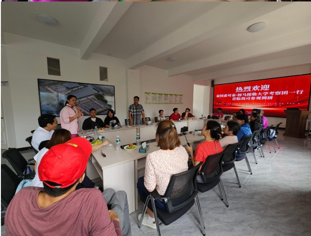
ภาพที่ 5 สันทนาการกับตัวแทนผู้ส่งออกที่มีประสบการณ์ในการจัดส่งผลไม้ไปยังประเทศต่างๆ