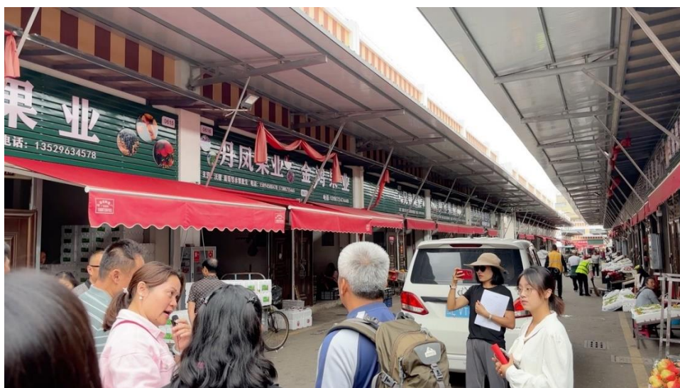
ภาพที่ 3 พื้นที่จำหน่ายสินค้าเกษตรที่ผลิตในมณฑลยูนนาน

ระบบการตรวจสอบคุณภาพที่เข้มงวดนี้ไม่เพียงแต่ช่วยให้ตลาดค้าส่งสามารถรักษามาตรฐานของสินค้าที่นำเสนอแก่ผู้ซื้อได้ แต่ยังเป็นการสร้างความสัมพันธ์ที่ดีระหว่างตลาดค้าส่งกับเกษตรกร ซึ่งเป็นคู่ค้าที่สำคัญในห่วงโซ่อุปทาน การที่ตลาดให้ความสำคัญกับการรักษาคุณภาพสินค้าตั้งแต่ต้นทางจนถึงปลายทางนี้ ยังช่วยสร้างความไว้วางใจให้กับลูกค้าที่มาเลือกซื้อสินค้าที่ตลาด Dali Dianxi เพราะพวกเขาสามารถมั่นใจได้ว่าสินค้าที่ซื้อไปนั้นได้รับการคัดสรรและตรวจสอบมาอย่างดีแล้ว