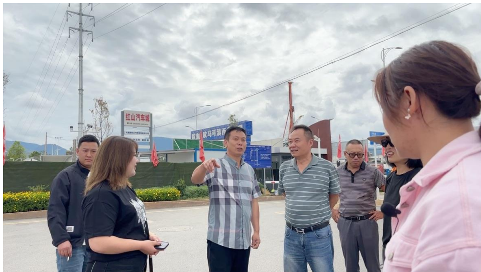
ภาพที่ 2 การสนทนากับทีมงานบริหารในบริเวณตลาด Dali Dianxi

ระบบการตรวจสอบคุณภาพที่เข้มงวดนี้ไม่เพียงแต่ช่วยให้ตลาดค้าส่งสามารถรักษามาตรฐานของสินค้าที่นำเสนอแก่ผู้ซื้อได้ แต่ยังเป็นการสร้างความสัมพันธ์ที่ดีระหว่างตลาดค้าส่งกับเกษตรกร ซึ่งเป็นคู่ค้าที่สำคัญในห่วงโซ่อุปทาน การที่ตลาดให้ความสำคัญกับการรักษาคุณภาพสินค้าตั้งแต่ต้นทางจนถึงปลายทางนี้ ยังช่วยสร้างความไว้วางใจให้กับลูกค้าที่มาเลือกซื้อสินค้าที่ตลาด Dali Dianxi เพราะพวกเขาสามารถมั่นใจได้ว่าสินค้าที่ซื้อไปนั้นได้รับการคัดสรรและตรวจสอบมาอย่างดีแล้ว