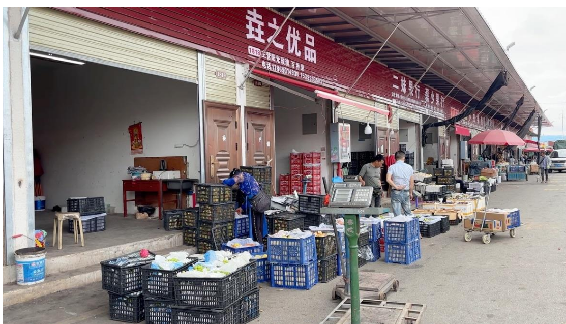
ภาพที่ 1 ลักษณะของร้านค้าและการวางสินค้าเกษตรเพื่อจำหน่ายในตลาด

จากการศึกษาดูงานที่ตลาดค้าส่งผลไม้ Dali Dianxi ในมณฑลยูนนาน เราพบว่าผู้ประกอบการในตลาดแห่งนี้ให้ความสำคัญอย่างมากกับระบบการรับซื้อสินค้าจากเกษตรกรในท้องถิ่น ซึ่งเป็นส่วนสำคัญในการสร้างความเชื่อมั่นในคุณภาพสินค้าที่จะถูกส่งต่อไปยังผู้บริโภค หนึ่งในกระบวนการที่ได้รับการเน้นย้ำเป็นพิเศษคือการควบคุมคุณภาพสินค้าอย่างเข้มงวด เริ่มตั้งแต่ขั้นตอนแรกที่ผลไม้ยังอยู่ในสวนของเกษตรกร ซึ่งเป็นที่มาของสินค้าที่จะเข้าสู่ตลาด ผู้ประกอบการจะทำการตรวจสอบคุณภาพของผลไม้โดยละเอียด เพื่อให้แน่ใจว่าผลิตภัณฑ์ที่ได้รับการเลือกสรรมาเป็นไปตามมาตรฐานที่กำหนด