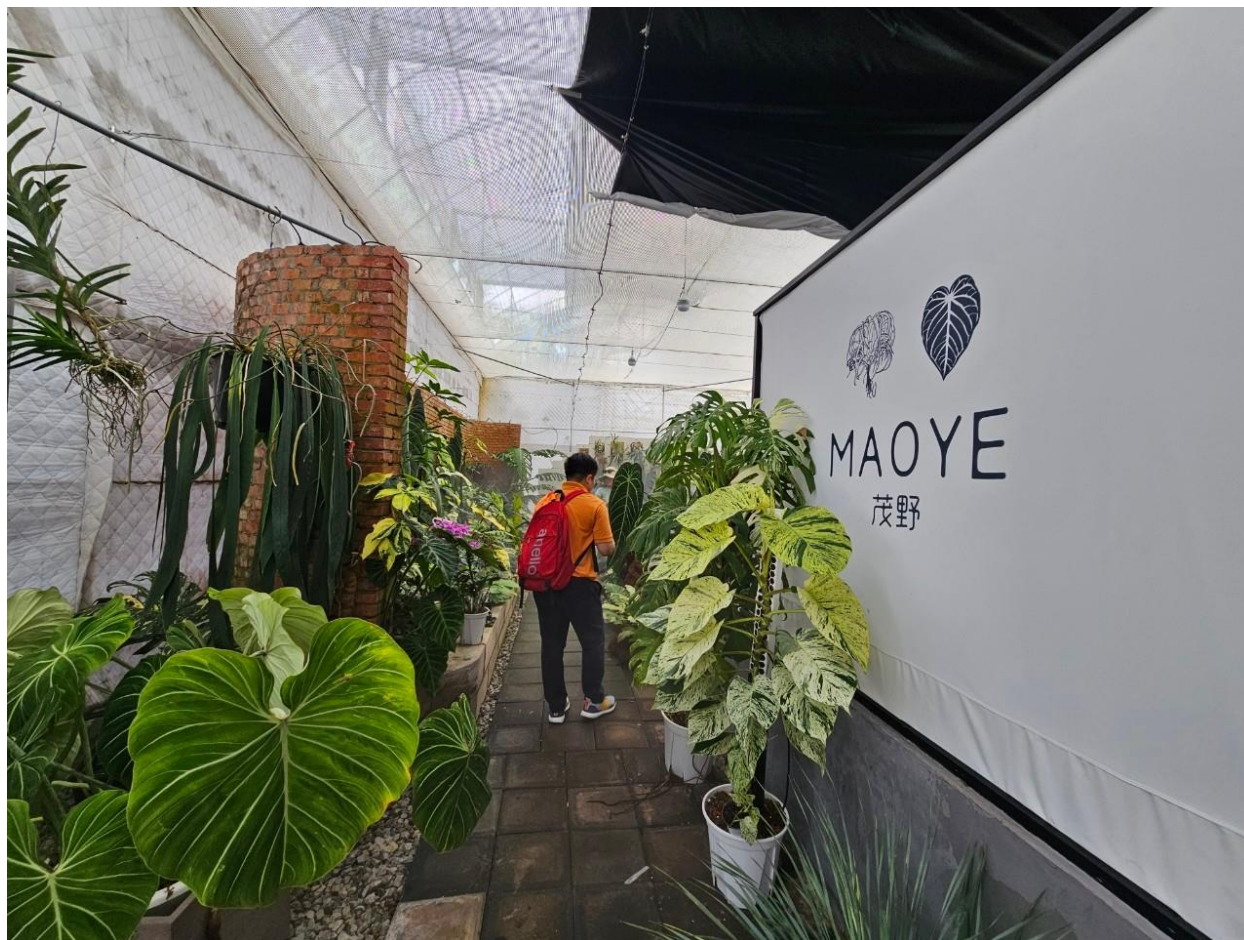
ภาพที่ 6 โรงเรือนพัฒนาการปลูกและผลิตไม้ประดับของบริษัท MAOYE

เทคโนโลยี ซึ่งส่งผลให้บริษัทสามารถจัดการทรัพยากรและพื้นที่การทำงานให้เหมาะสมกับกระบวนการผลิตอย่างเต็มที่ บริษัทได้มีการจัดสรรพื้นที่การทำงานอย่างเป็นระบบ โดยแบ่งออกเป็นหลายโซน เช่น โซนการปรับปรุงพันธุ์พืช โซนการเตรียมการปลูก โซนการบรรจุภัณฑ์ และโซนการประชาสัมพันธ์ การแบ่งพื้นที่เหล่านี้ไม่เพียงแต่ช่วยให้การทำงานเป็นไปอย่างราบรื่น แต่ยังช่วยเพิ่มประสิทธิภาพในการจัดการทุกขั้นตอนของกระบวนการผลิต