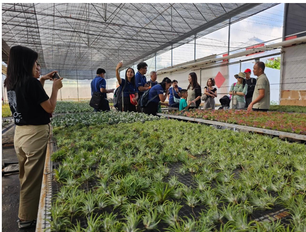
ภาพที่ 8 สนทนากับทีมผู้บริหารของบริษัท MAOYE

การศึกษาดูงานที่บริษัท MAOYE ยังให้เราได้เห็นถึงวิสัยทัศน์ในการขยายตลาดไปสู่ระดับสากล โดยบริษัทมีแผนที่จะขยายการส่งออกไม้ประดับไปยังประเทศต่างๆ ทั่วโลก ซึ่งจะช่วยเพิ่มโอกาสทางธุรกิจและสร้างความมั่นคงให้กับบริษัทในระยะยาว การที่บริษัท MAOYE ได้รับการสนับสนุนจากภาครัฐทำให้การขยายตัวนี้เป็นไปอย่างราบรื่น และเปิดโอกาสให้บริษัทสามารถแข่งขันในตลาดสากลได้อย่างมีประสิทธิภาพ